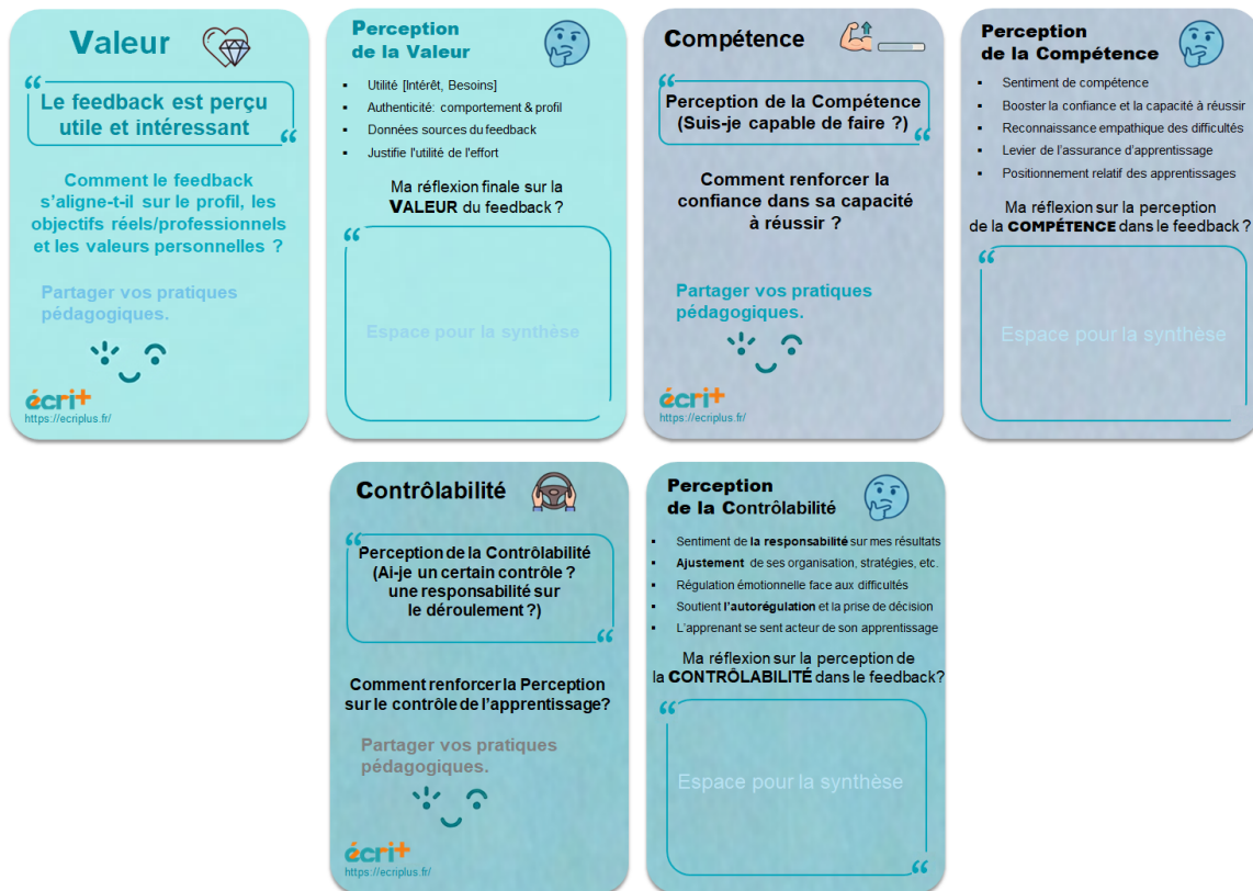
Figure 1: Design cards pour la réflexion sur le modèle VCC de Viau (Valeur, Compétence, Contrôlabilité).